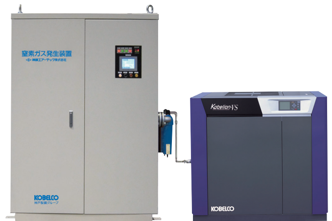
SAT CNeco4-20 窒素ガス発生装置